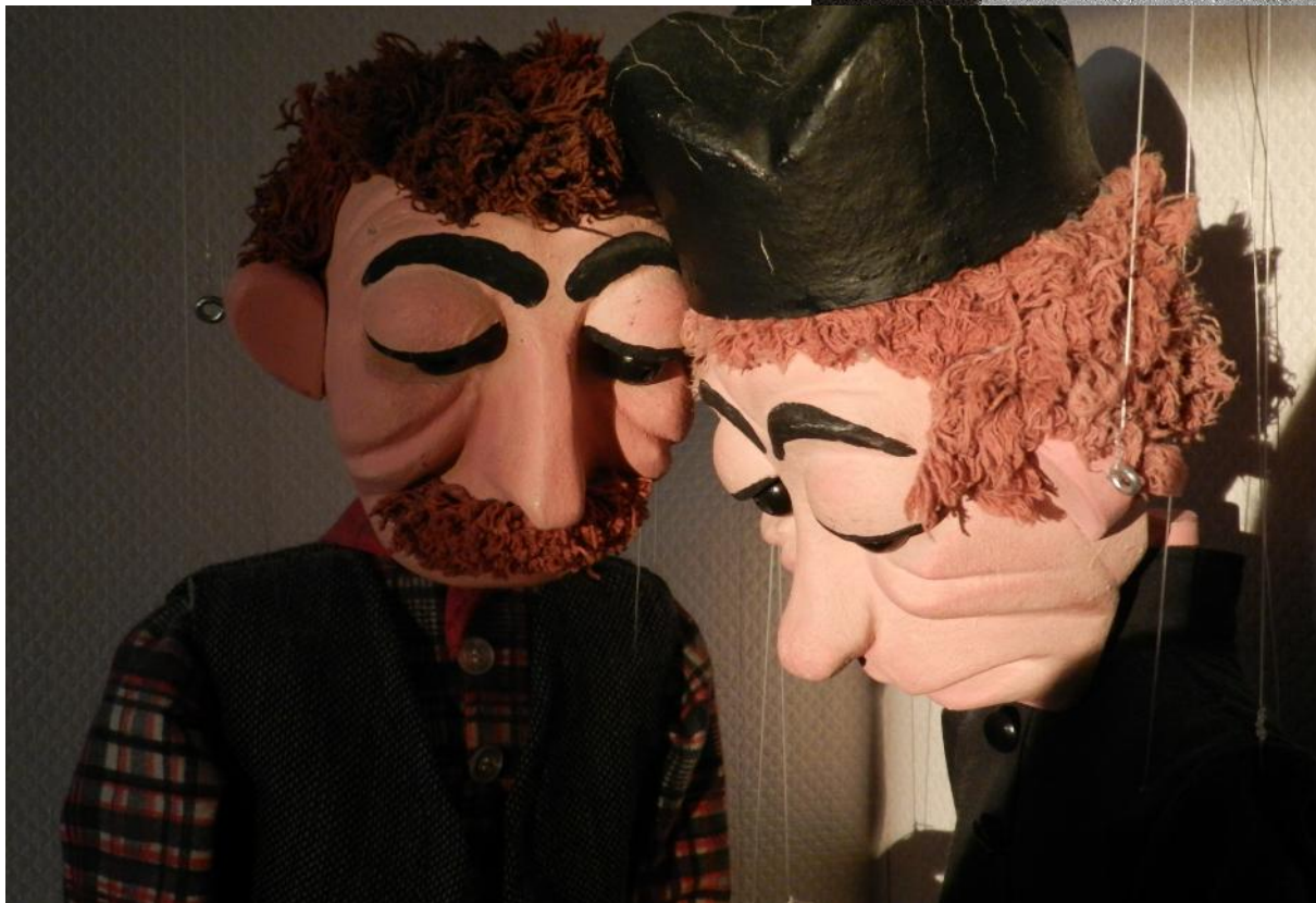
Don Camillo und